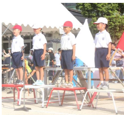
落ち着いて可愛らしく語りかけた1年生赤白4人の“開会のことば”