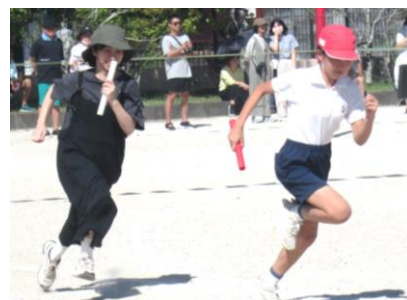
走り方ソックリ! 6年「世代交代」