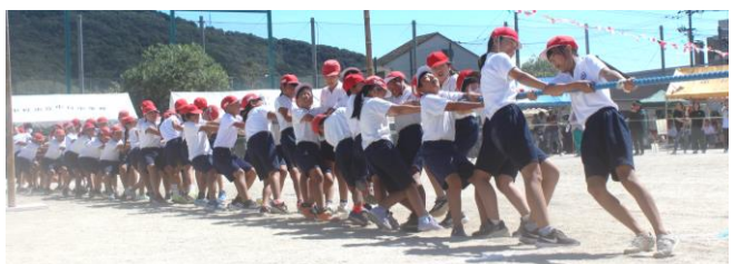
↑力を尽くした綱引き 高学年1本目は見応え抜群! マスト登り 代表選手は緊張感漂っていました→