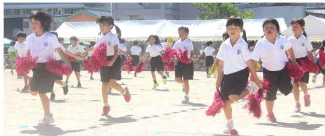
1つ1つの動作が可愛らしくまとまって…