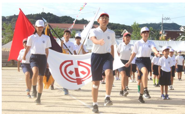
まじめに活躍活動する前期児童会役員5人の堂々とした行進でスタートした“2023運動会”

児童会で決めた今年の運動会のスローガンは「仲間と楽しめ 最高の運動会」。子ども達は、ご家族の皆さんをはじめ観客の皆さんの温かいまなざしに見守られ、応援に勇気と励ましをもらいながら、開会式から閉会式まで、競技、演技、応援、係の仕事…、それぞれに二度とない今年の運動会が自分にとって最高の運動会となるよう、上級生・下級生・同級生…仲間と共に楽しみ、全力を尽くしてがんばり、躍動する姿が展開されました。