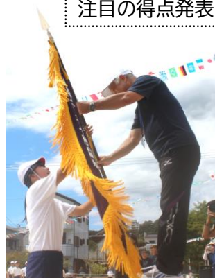
優勝旗は白組の団長へ