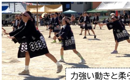
力強い動きと柔らかい動きを織り交ぜて…