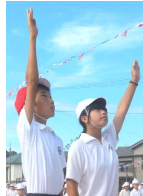
赤白応援団長の“選手宣誓”で気分が高まりました