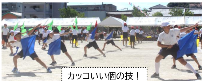
カッコいい個の技!