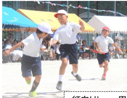
紅白リレー 男女とも練習の時はいつも大接戦でした