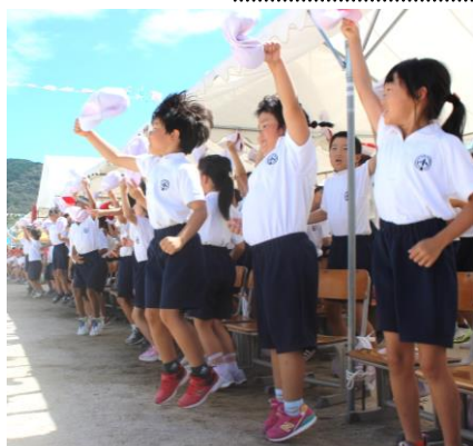
赤も白も応援団と児童席が一体となり いきいきとした応援が繰り広げられました